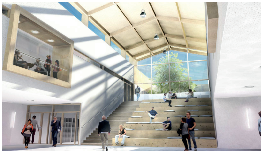
Le nouveau hall, les élèves vont l'adorer !