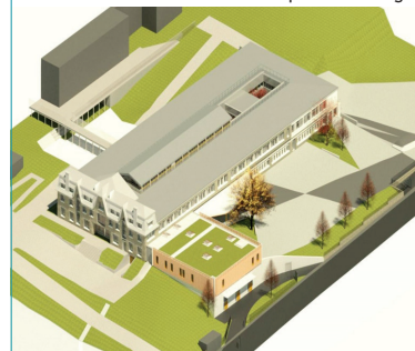
Perspective aérienne du bâtiment E avec extension du service de restauration & parvis aménagé