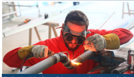
Un chantier génère des emplois : tous corps de métiers confondus, 80 compagnons ont été mobilisés sur la construction du bât. A.