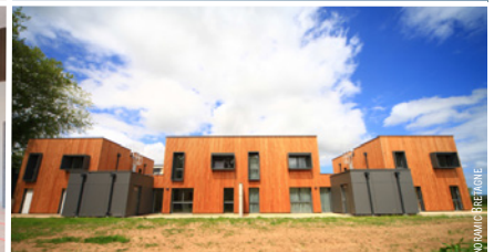
Quatre logements de fonction ont également été construits.