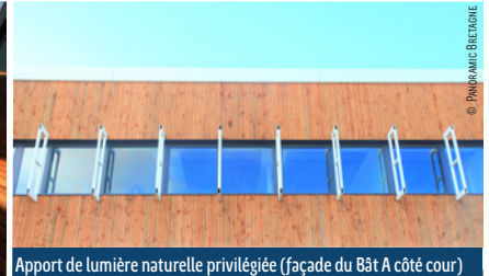
Apport de lumière naturelle privilégiée (façade du Bât A côté cour)