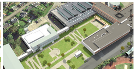
Les ateliers en travaux. Au second plan le nouveau bâtiment A