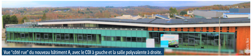
Vue "côté rue" du nouveau bâtiment A, avec le CDI à gauche et la salle polyvalente à droite.