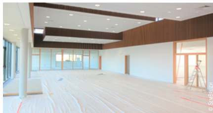
Le CDI et ses beaux volumes, à l'heure des finitions.