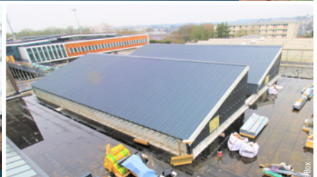
Les ateliers en travaux. Au second plan le nouveau bâtiment A