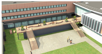
Les prochaines étapes consistent à créer une passerelle et à aménager la cour paysagère entre le bâtiment A et les ateliers.