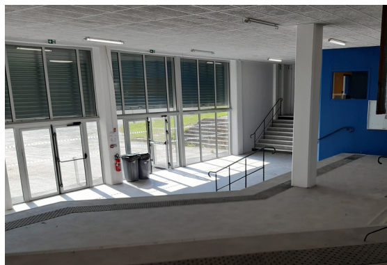
Le préau existant a été fermé afin de créer un hall d'accueil plus confortable qui donne accès aux différentes parties du lycée et à la cour extérieure.

Juillet 2021 : livraison du nouveau lycée et aménagement