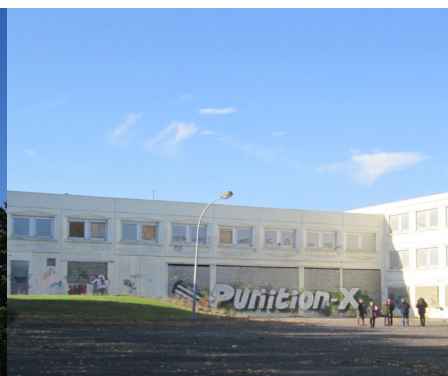
Le bâtiment de l'externat vu côté cour. Photo de gauche : après rénovation de la Région Photo de droite : avant rénovation.