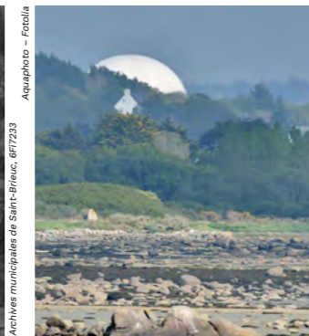
Archives municipales de Saint-Brieuc, 6F723 Aquatphoto - Fotolia