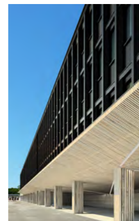
Océanopolis Anthracite Architecture

la Sagesse à Rennes, le pôle universitaire de Quimper, l'université Victor Segalen à Brest ou plus récemment le Campus des Métiers à Guipavas. Ce sont aussi, à partir de 1999, les opérations sous mandat pour le compte de la Région Bretagne dans ses 116 lycées publics .