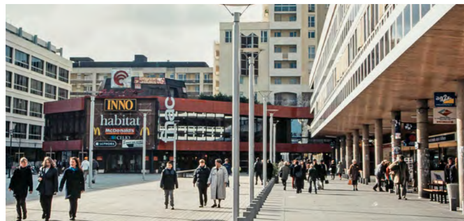
Archives de Rennes, 30F150_002, Michel Ogier

équipements autour d'une dalle centrale. Les opérations mixtes en cœur urbain deviendront une signature de la Semaeb qui les multiplie à diverses échelles jusque dans les années quatre-vingt-dix, par exemple la ZAC de la Gare à Rennes, ou encore l'Orientis , le pôle urbain central de Lorient (50 000 m 2 ).