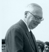
Archives municipales de Saint-Brieuc, 6186418