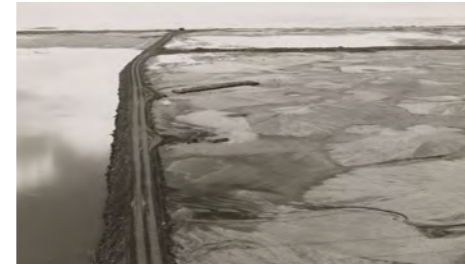
Collection des Archives de Brest, 2F03160_02

Être l'outil relais de l'essor économique breton est la première raison d'être de la Semaeb : elle commence l'aménagement des zones industrielles en Bretagne dès la fin des années cinquante. À Brest, la zone portuaire représente un défi. Il est confié à la société d'économie mixte en 1962. Ce secteur dit « de Saint-Marc » est complexe : il a nécessité de gagner 50 ha d'emprise foncière sur la mer en créant un remblai et un polder. La Semaeb compte à son actif un très grand nombre de zones industrielles ou d'activités, des technopôles, la construction d'usines, des programmes en immobilier d'entreprise.