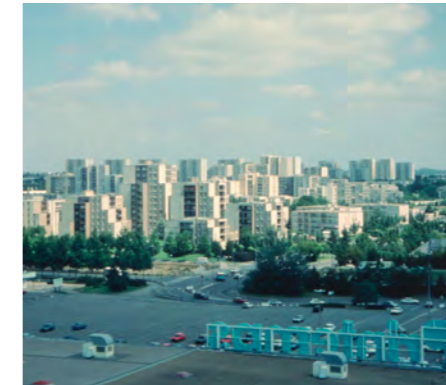
Archives de Rennes, 30F510_001

Rapidement, l'urgence de la crise de l'habitat amène les Villes bretonnes à aménager des quartiers neufs, les zones à urbaniser en priorité (ZUP). À partir de 1959, la Semaeb développe le Plateau-Central à Saint-Brieuc qualifiée de ZUP modèle, Bellevue à Brest qui compte aujourd'hui 20 000 habitants, le Blosne « ZUP Sud » de Rennes, Kermoisan à Quimper et de nombreux autres. Autant de grands ensembles qui caractérisent les années soixante. Puis, les ZAC remplacent les ZUP. Entre les années quatre-vingts et deux mille, une urbanisation douce voit le jour, par exemple les Longs Champs à Rennes, préfiguratrice des écoquartiers d'aujourd'hui.