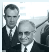
Archives de Rennes, 350f123_63

Homme d'État, élu des Côtes du Nord, Président du Conseil sous la IV e République, ministre. Figure de proue du régionalisme breton des années cinquante, cofondateur du Celib. Il crée la Semaeb, société outil du développement breton, et la présidera pendant douze ans.